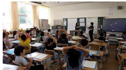
6/17 4年生福祉体験（手話）