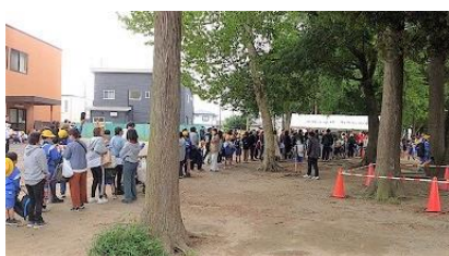
5/24 おやじの会模擬店