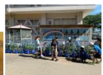
2年:やさいの水やり