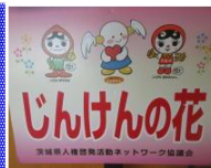
栽培福祉委員会 (人権の花運動)