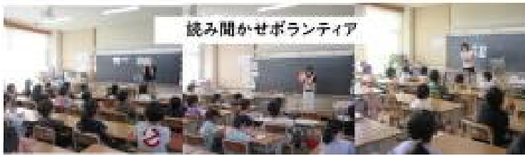
読み聞かせボランティア