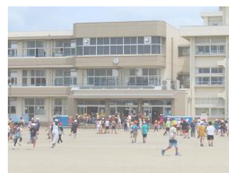
休み時間終わりのチャイムが鳴ると 一目散に昇降口へ 前小のよい伝統です