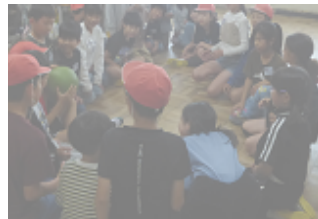
仲良し学級活動(6/9(火)ロング昼休み)