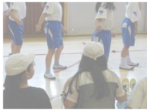
6年生が1年生の体カテストをお手伝い