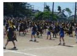
背中文字に思いを込めて…