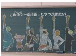
黒板の激励メッセージ

これからも、子どもたちを真ん中に据えながら、皆様と手を携え、共に成長を支えていきたいと思っております。今後とも、ご理解とご協力をどうぞよろしくお願い申し上げます。