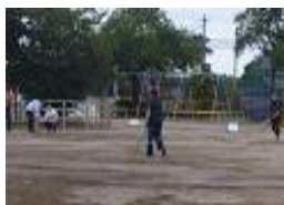
朝からグラウンド整備