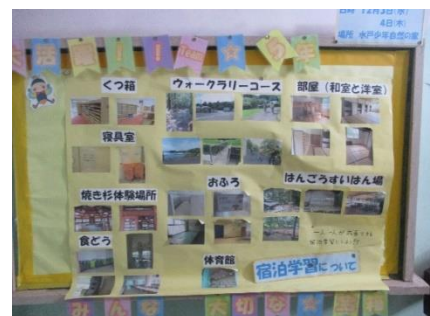
宿泊施設を紹介するための掲示物