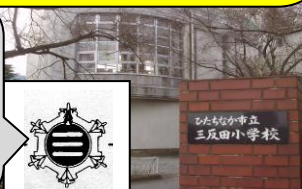
校章は、蛸と雪を合わせた形です。