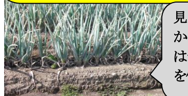
見ると貝ばかり。ここは昔の貝塚を使った畑