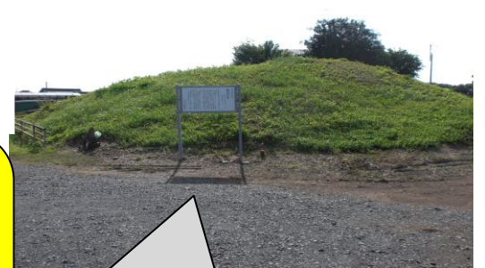
代表的な飯塚前古墳 毎日たのしい学校

わたしたちのふるさと三反田はどうでしたか。いつも登下校で見ている様子も、今回調べてみたことで知らなかったことや気づいたことがたくさんありました。そして、わたしたちのすんでいる三反田はとて素晴らしいところだなと思いました。この地域自慢を見てくれたみなさん、三反田へあそびにきてください。お待ちしております。