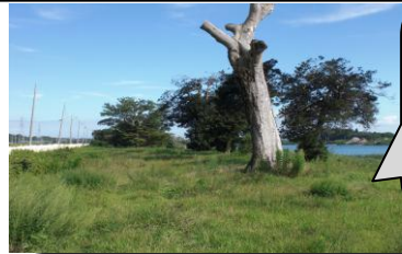
光 ゆかり の 百色山