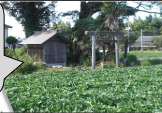
珍しい 名前の 鶏卵 神社