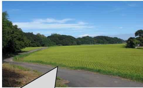
那珂川沿いに広がる田んぼ 台地にはさつまいも畑