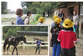
セント乗馬クラブ