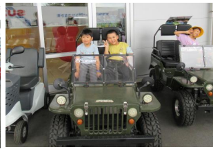
タックスイソザキ